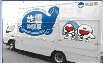
地震体験車 なまず III世号