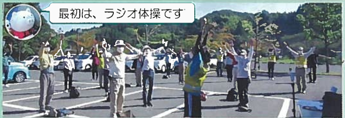
最初は、ラジオ体操です