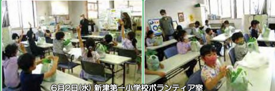
6月2日(水) 新津第一小学校ボランティア室