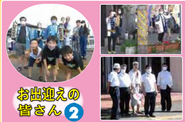
お出迎えの 皆さん 2