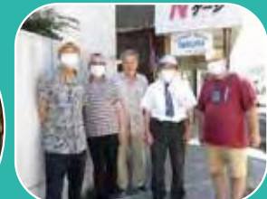
お出迎いの 皆さん ①