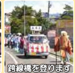
跨線橋を登ります