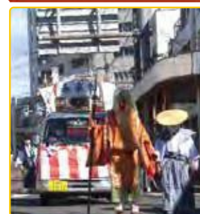
祭 祭 祭 新津本町2丁目