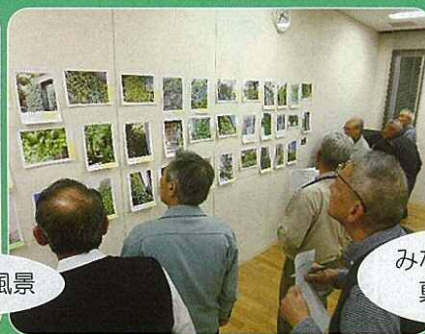
みなさん、真剣です。