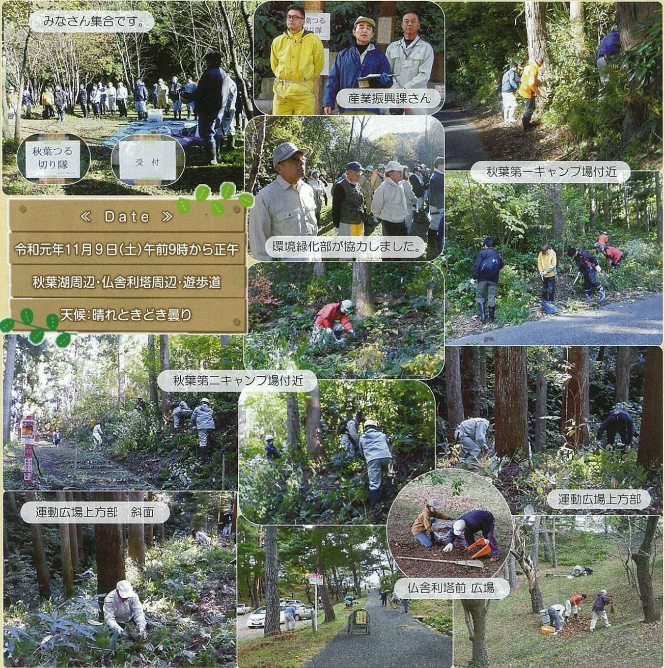
みなさん集合です。