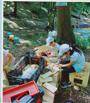
大工コーナー (工作)