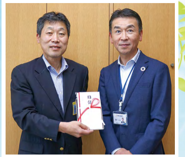
長崎区長(左)と第四北越銀行新潟支店 藤原支店長(右)

株式会社第四北越銀行様より、秋葉区へ寄付金20万3千円をいただきました。この寄付金は、秋葉区が提案する移住、定住の促進を目的とした「アキハスプロジェクト」の活動に賛同をいただいたもので、今後秋葉区の魅力を発信するさまざまな取り組みへと使わせていただきます。