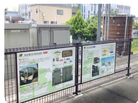
エコステーションとしてさまざまな設備がある