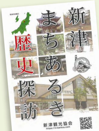
冊子「新津まちあるき歴史探訪」

里山、花、鉄道、歴史…さまざまな魅力ある秋葉区をまちあるきしてみませんか。秋葉区観光ボランティアガイドの皆さんが秋葉区の魅力を楽しむコースを案内します。