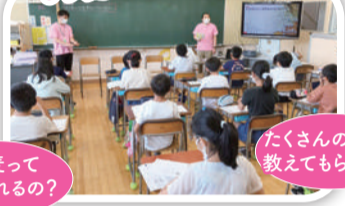
講師:(福)親和福祉会