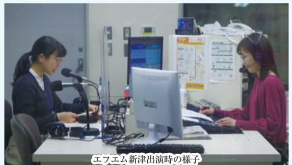
エフエム新津出演時の様子