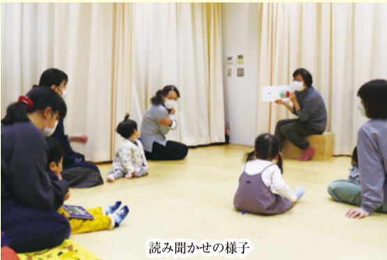
読み聞かせの様子

火曜日と土曜日にボランティアさんによる読み聞かせ「おはなしのじかん」を開催しています。楽しい手遊びもあり、親子で一緒に楽しめます！