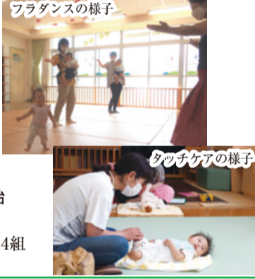
フラダンスの様子