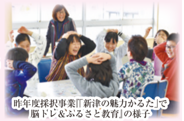
昨年度採択事業「新津の魅力ある」で脳トレ&ふるさと教育の様子

日時 7月3日(水)午後7時～ 会場 新津地域交流センター 201研修室 対象 区内に主な活動拠点がある非営利のグループ・団体(法人を含む) ほか 申し込み 7月2日(火)までに地域総務課 企画担当 (FAX22-0228、電子メールchiikisomu.a@city.niigata.lg.jp)