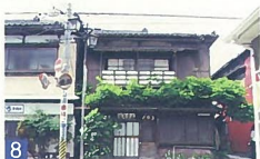
8 日本そば むらた 学校町 昭和30年代の町屋の面影を残しているお店で、緑と緑と合っています。