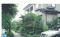
17 通りの街路樹と敷地の緑が相まって、とても雰囲気の良い潤いの空間を演出しています。