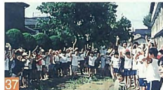
37 沼垂小学校生き物ランド 鏡が岡 ピオトープは、春夏秋冬いろいろ姿をみせてくれます。全学校に広がれば良いと思います。