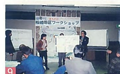
9 通船川・栗の木川川ルネッサンス 通船川・栗の木川流域 住民の直接参加による川再生の活動と結果を知ってください。