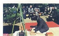
15 新潟市民茶会 市内各所 秋の風物詩として親しまれ、茶席数や参加人数等日本一の大会となっています。