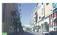
34 BPとBP2の間の通り 八千代2 新潟も都会っぽく感じる洒落た街並みです。