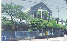
11 二葉幼稚園園舎 西中町 大正初期に建てられた園舎を建て替えしましたが、以前と同じ外観に再生した建物です。