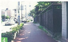
4 内野の町 内野町 夕方のオレンジ色の光が町全体を包む時、古い街並みや遠くに夕日に染まった山を見ると素敵です。