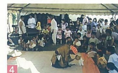
4 下町の祭り 濃福神社周辺 7月初旬から、下町のあちこちの神社で夏祭りが始まるこのときばかりは、子供達でにぎわっています。