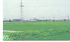
65 白新線ローカル列車と水田 松海地区 水田の中を走るローカル列車の光景は、田園都市を目指す新潟にいつまでも残したい風景です。