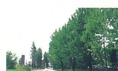
55 ポプラ道 海老ヶ瀬 バイパス沿いのポプラ並木は、新線から盛夏過ぎまでドライバーの心を和ませてくれます。