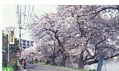
41 通船川の下開門開閉 榎町 筏曳航のため、開門を開けると水が勢いよく流れる光景に感動します。