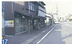
17 がん木作りの店(可月堂) 湊町4 鎌倉時代をしのぼせるがん木づくりのお店で、市内には数少なくなってきました。