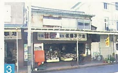
3 ひっそりたすむ昔ながらのお菓子屋さんで、懐かしい気持ちにさせてくれます。