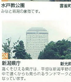
24 新光庁 新光町 高くそびえる興行は、平坦な新潟平野の中で遠くからも見られるランドマークとなっています。