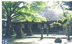
18 旧西方寺 鳥屋野1 市内では珍しいかや葺き屋根のお寺で、菩提樹や赤松などの保存樹に囲まれ、伝説の逆さ竹があります。