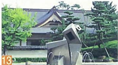
13 市役所前の噴水 一番畑通町 市役所前に設置された小公園で、噴水が夜もライトアップされ楽しい所です。