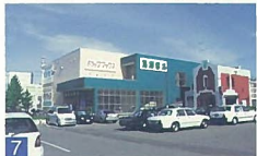
7 白山駅のドラッグマックス+蔦屋 白山浦2 駅のプラットフォームから見られる景観を配慮し、看板と建物が調和するようデザインしています。