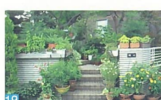
18 庭に映えた大きな木と、いつも咲いている花が印象的です。