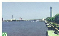
30 万代橋からの河口 信濃川河口 信濃川の雄大な流れの中に船が停泊している光景が、港らしい美しい景観です。