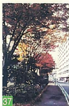
37 ミニケヤキ通り 天神2 市民にあまり知られていないこの通りは、四季を通じて素晴らしい絶品の景観です。