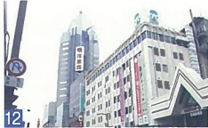
12 NEXT 2 1 西堀通6 2 1階建て、威風堂々と空にそびえ立ち、イカの形の屋根に光が反射し、遠くからも美しいと感じます。