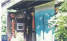
16 キレイ茶藝館 東堀 玄関脇の竹が小路に潤いを与え、看板やメレンゲの色づかいがきれいでとても良いです。