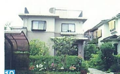
19 四季ごとに花が咲いており、空間にゆとりを感じさせています。