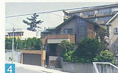
4 高低差の敷地を生かし、明るくソフトな色づかいで、統一感のある外観を見せています。