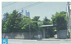
5 こんな町中に、こんな素晴らしい屋敷林があるのかと驚かされます。