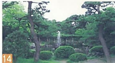
14 白山公園 一番畑通 春は桜、夏祭り、水運、紅葉、冬のたつしまいも趣があり、心休まる場所となっています。