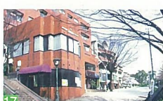
17 どっぺり坂周辺 西大畑町 周囲の落ち着いた住宅街に合った、とても素敵な風景です。