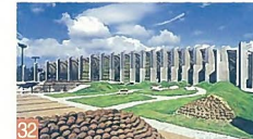
32 鳥屋野潟公園列柱廊広場 清五郎 周囲のある列柱のため、大きさのわりに圧迫感がなく、休憩等に利用されているシンボリックな広場です。