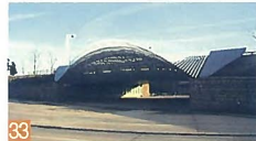
33 鳥屋野潟公園バイザーゲート 清五郎 ビッグファンと呼ばれるよう、白鳥の羽根のようなしなやかなシルエットを見せています。