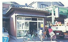
7 今時、だがし屋なんて珍しいお店で、多くの子供達がお菓子を買いにきます。