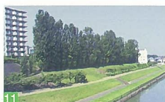
11 関屋分水ポプラ並木 関屋分水水路 河畔に展開するポプラ並木のさわやかさと斜面に咲く花文字のロケーションが抜群です。 都市景観賞部門賞