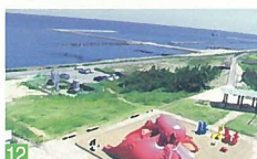
12 関分記念公園の展望 浜浦町 通称タコ公園とも呼ばれ、日本海はもちらん市内も展望できます。