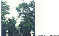
27 山の下 神明宮 鷹町 山の下町のシンボルです。