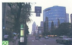
29 礎町付近からの榎谷小路夕焼 礎町 鏡橋からの街並み夕景は素晴らしい、局面ガラスの壁面やビル群が美しく輝いています。