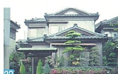
22 建物は和風ですが、期垣前に飾られている華花は洋風で、このアンバランスさが面白い。