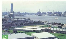
42 みなとトンネル山の下タワーから西港の眺め 臨海町 西港全体を眺める景色は、今までの新潟で見る事の出来なかつた景観です。