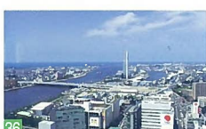
36 レインボータワーからの眺望 万代1 タワーも景観資源ですが、上から見た街の眺望も素晴らしいです。