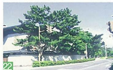
22 歴史ある樹木 一番堀通町 堀を切断してまで、樹木の成長を妨げないようにしています。