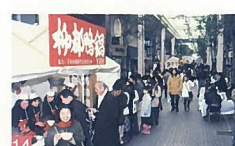
14 新潟食の陣 市内各所 冬の新潟は寒くて痛いイメージですが、食の陣には冬の味覚を求めて多くの人が訪れ、熱気あふれています。