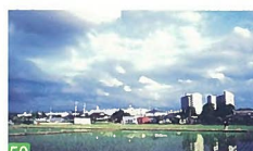
50 田園都市新潟 曾野木 近代的な建物が水を湛えた水田に映る姿は、都市と田園が調和し素晴らしい景観です。