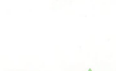
16 キレイ茶藝館 東堀 玄関脇の竹が小路に潤いを与え、看板やメレンゲの色づかいがきれいでとても良いです。