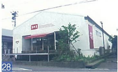
28 S.H.S.鳥屋野 女池南3 倉庫を改装した店舗ですが鳥屋野海や周辺の文教地区の雰囲気に調和しています。