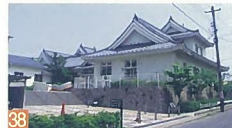
38 こども創作活動館 牡丹山1 「お城」という新潟には珍しいランドマークの建物で、近隣の子ども達のふれあいの場となっています。