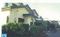
13 ブロック塀をツタで覆い隠し、緑豊かな雰囲気を演出しています。