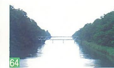
64 大正橋からの眺め 松浜 大正橋から新井堀川の河口を望む光景は、樹木の遠近感があり素晴らしい景観です。