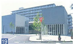
19 ルーテシア 近江 コンクリート打ち放しの建物に、おしゃれなお店が入っていて、とても雰囲気の良い素敵な建物です。