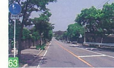
63 松浜の坂道 松浜 高台の国道から、松浜中学越しに日本海を望む坂道の風景が素敵です。