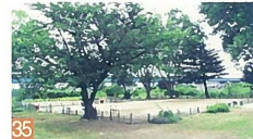
35 古中グラウンド 酒屋 昔の両川中のグラウンドで、お花見やカブトムシ捕り、スポーツ等が出来る広い場所です。