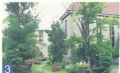
3 味蔵 ときめき西3 ヨーロッパを思わせるような建物と緑と花のあふれる景観は、人々に安らぎを与えてくれます。都市景観賞 部門賞