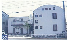
22 m・ROOF 上所 ちょっと変わったアパートで、色合いや看板がおしゃれでかわいらしいです。