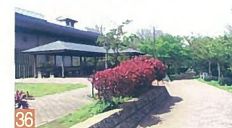
36 山の下緑地 末広町 寒い冬の夜に、暖かな光を放つ公園の街灯が、空と雪を照らし暖かい風情を与えてくれます。