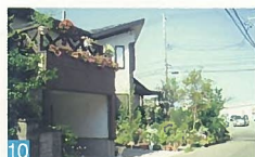
10 白くほいっと変わった形の建物が、木や花越しに見え高層のような雰囲気です。