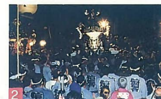
2 新潟まつり市民神輿宮入渡御 白山神社境内 新潟に根付いた神輿の風景としては、日本一と言われるほど素晴らしい景観です。