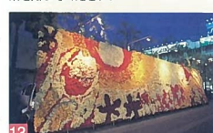
13 にいがた花絵プロジェクト 市内各所 市の花「チューリップ」を生かしたイベントで、市民参加を促すきれいな花絵をつくっています。 都市景観賞 部門賞