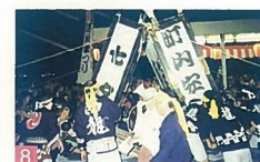
8 沼垂祭り 旧沼垂地内 300年あまりの伝統のある勇壮な祭りで、これからも継承し後世に残していきたい。