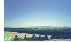
66 安古左工門の丘からの山並み眺望 太夫浜 晴れた空気の澄んだ日に、丘から見える山々はひとさききれいに良く見えます。