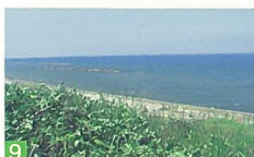
9 青山海岸自然景観 青山 「広がる樹海、沈む夕日に日本海、遠くに望む佐渡島」このダイナミックな景観が楽しめます。