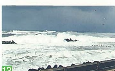
13 冬の日本海 西海岸 風雪が強く波浪の高い冬の日本海の表情は、冬の新潟の情景の一つになっています。