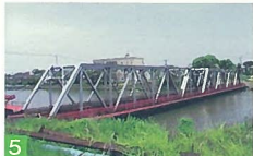
5 新川水路橋 新川 新川の上を水路橋が走る非常に珍しい橋です。