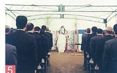
5 郷土歴史博物館安全祈願祭 郷土歴史博物館(仮称) 近年まれにある豪華な式典で、新潟の文化を後世に伝える価値があると感ずる式典でした。