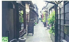
25 東堀の小路 東堀通4 町屋を改装した洒落たお店が建ち並び小路で、極木の縁と相まって素敵です。