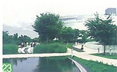
23 芸文会館周辺の緑地 一番堀通町 周辺の施設が空中庭園で一体的に結ばれ、市民に親しまれる中心的な公園となっています。