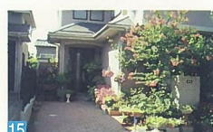
15 道路に面して花や木があふれ、2階のバルコニーにも花が飾られて、美しい建物です。