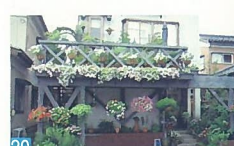
20 道路に大きく張り出したウッドデッキに花が咲き、道行く人を楽しませてくれます。