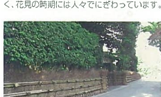
53 東北電力火力発電所敷地の桜並木 桃山町2 発電所の機械的な建物との調和が意外と美しく、花見の時期には人々ににぎわっています。