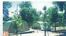
45 海辺の森 島見町 雄大な日本海を眺めながら、松林の中で自然を満喫でき、キャンプをしながらの星空は最高です。