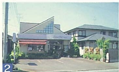
2 ガトーシェフ三味堂 寺尾前道2 駐車場に花や緑があふれ、窓からはかわいらしいシェフが優しく迎えてくれます。