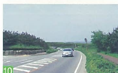
10 R402号沿線 青山 「白砂青松」新潟らしい海産物です。