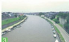
3 新川元橋からの眺望 新川 夕映えの頃、橋上より漁港を見渡す景観が良く、静かな川の流れに心が洗われます。