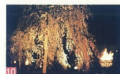
10 じゅんさい池の観桜会 松園2 かがり火とライトアップされた「しだれ桜」の光景は、素晴らしい一言です。