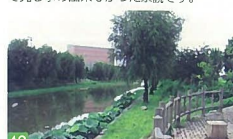
46 新堀排水路 鐘木 昔の趣を感じ出すような庭で、岸辺の柳も大きく成長し美しい景観となっています。