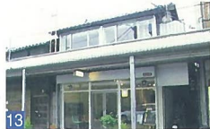
13 foodelic 古町3 町屋を改装したお店で、古い趣ある梁と柱のある空間に、新しい感覚のカフェが融合しています。