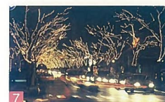
7 光のページェント 駅南ケヤキ通り 光のペールに包まれるケヤキ通りは、とてもロマンティックで素晴らしい景観を醸し出しています。