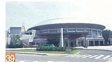
39 東総合スポーツセンター はなみずき3 珍しい丸い屋根のどっしりとそびえ立つ建物で、周辺のランドマークになっています。