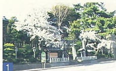
1 坂井神社 坂井砂山 こじんまりした神社ですが、色々な花や木が植えられ四季折々に花が楽しめます。