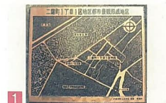
1 二葉町一丁目地区 二葉町1 住民が主体となって景観形成に取組み、自分の町に愛着や誇りを感じるような街づくりを進めています。 都市景観賞 部門賞