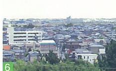
6 車窓からの坂井橋、黒崎の街並み小針付近の越後線 車窓からの風景は、広がりゆとりを感じさせてくれる美しいポイントです。