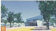
5 西海岸プール 関屋 建物の周囲や屋根に植栽をほどこし、周辺の風致地区の景と調和をかし出しています。