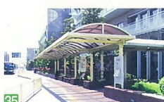
35 総合福祉会館周辺 八千代1 沿道の建物と歩道が一体的に整備され、すっきりさわやかな雰囲気を出しています。