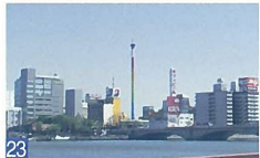
23 レインボータワー 万代1 市内のどこからでも見えるタワーで、万代橋を前景にした姿が美しい。