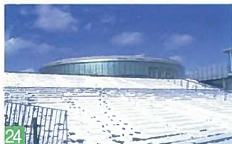
24 雪景色の芸文会館周辺 一番堀通町 雪の降る静かな夜、雪に白熱灯が優しく反射し、幻想的で雪の精の灯を見るようです。