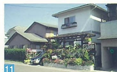
11 花屋さんと見間違えるほど、火山のお花が飾られています。