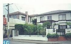
16 通りに沿ってバラが植えられ、春には咲いたバラが似合う建物です。