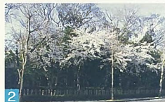
2 前庭と屋敷林が素晴らしい、沿道にとてめば麗らかな空間を提供しています。