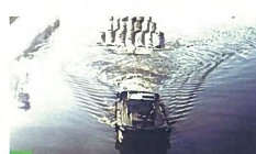
54 通船川の筏曳航 通船川 全国的にも珍しくなった筏の曳航は、一度見ると感動すること受け合いです。