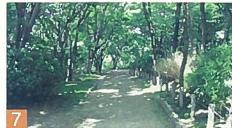
7 西海岸公園の小径 西海岸公園 北原白萩が新潟の子供達に作った童謡「砂山」の石碑がある、風情のある小径です。