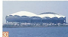
30 新潟スタジアム 清五郎 白鳥が羽を広げた優雅な姿が鳥屋野潟の自然に溶け込み、新潟の新しいシンボルとなっています。都市景観賞