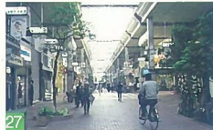
27 古町通7番町アーケード 古町通7 リニューアルしたアーケードや右詰りの柱などが、新生古町をイメージさせます。