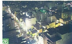
26 NEXT21からの眺め 西堀通6 新潟の素晴らしい夜景を見ることが出来ます。