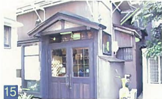
15 fille 東堀 レトロな雰囲気のあるお家で、小路の古びた雰囲気にとっても合っています。