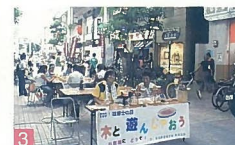
3 「建築士の日」記念事業 ふるまちモビル建築士会のイベントで、地元商店街と協力し街の活性化に貢献しています。