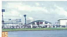
15 新潟市体育館 一番畑通町 都市公園内に建つシェル構造の建物で、緩やかな傾斜屋根が美しく映えています。