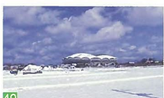
45 鳥屋野湯の桜並木 鳥屋野湯 市内で最も古く本数も多いこの桜並木は、自慢できるスポットです。