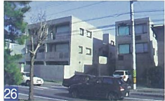
26 コートハウス女池 女池神明1 現代的な外観と自然素材を使った外構がマッチし、RC造の質感と緑の組み合わせがきれいです。