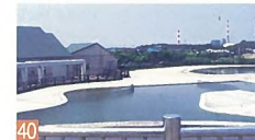
40 山ノ下海浜公園 船江町 飛行機近くの海沿いにある公園で、飛行機が近くを飛ぶのが見れる公園です。