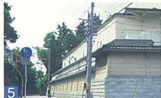
5 ときめき会館 西舟見町 狭い道路に面しているため、2階部分をセットバックし、通りの圧迫感を和らげる工夫をしています。都市景観賞 部門賞