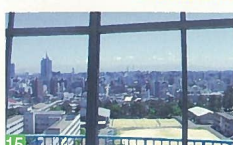
15 日本海タワーからの眺望 旭町通2 晴れの日に、遠くに佐渡島が見えたり越後の山並みが見える眺望は素敵です。