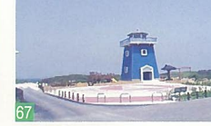
67 海辺の森展望塔 島見町 海との調和がとれている展望塔です。