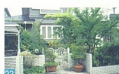
23 道路に面した木を低く抑え、庭の中が見渡せるようになっており、緑がきれいなお家です。