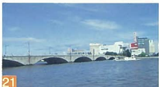
21 万代橋 信濃川 新潟の中心を流れる川に人々が橋を架け、街の発展の原動力となったのがこの万代橋です。