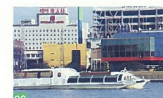
69 ウォーターシャトル 信濃川 町を渡る船は変われど、水上の交通手段としての船の復活はうれしいものです。