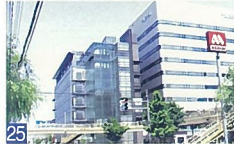
25 コスミックビルII 万代 ガラスとコンクリート打ち放しの建物がおしゃれで、都会的な雰囲気を作り出しています。