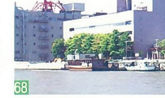
68 屋形舟 万代丸 信濃川 舟から新潟の夜景や万代橋等の橋を川面から見ると新鮮な感があります。