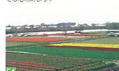
51 休耕田のチューリップ畑 両川 堤防道路から見えるチューリップ畑は、ハッとさせられるほど鮮やかで印象的です。