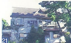
21 ファミールハイツ鶴木 上所3 テレビドラマに出てくるような、洋館の雰囲気がとても素敵です。