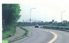
33 本線大橋右岸道路 新光町 新道も都会っぽく感じる洒落た街並みでよく走行することが出来ます。