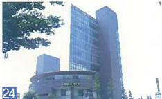
24 コスミックビルI 万代 歩道に配慮して建物をセットバックし、角地をうまくデザインしています。