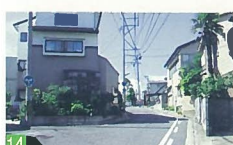
14 岡本小路 学校町通 この地に下宿していた音楽教師が、作詞した歌を新潟高女の生徒に歌わせた詩情豊かな通りです。