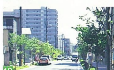
18 オギノ通り 奇居町 洒落た建物が、街路樹とマッチして建ち並び落ち着いた街並みです。