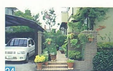
24 屋根や外壁、門柱の色が淡い色調でまとめられており、それに緑が調和し良くデザインされています。