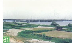
61 白新線からの眺め 阿賀野川鉄橋 白新線から望む阿賀野川の中央は、自然豊かで心が和みます。