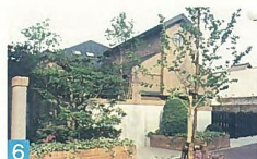
6 アプローチ部分の緑を外部に開放し、建物の重厚感と調和して、とても素晴らしい景観です。