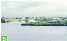
8 信濃川と中之口川合流点 山田村返の河川敷 2つの川が合流し、広い川面をつくり、豊かな自然も残り、越後山脈を背景にした景色は絶景です。