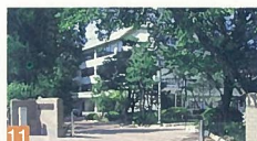
11 寄居中学校 笠所通2 校舎改築に際し、周辺の街並みに調和させた外観づくりや前庭を開放する等の工夫を取り入れています。