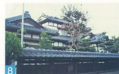
8 最近あまり見かけない、古風で重厚感のある和風の建物です。