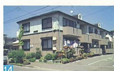
14 アパートなのに、こんなにまでしているのかなと思うほど、花がいっぱい飾られています。