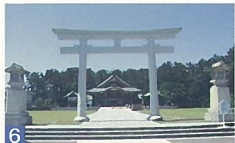
6 護国神社 西舟見町 松林の中にたたずむ神社、参道、裏参道が緑と調和して美しい姿を見せています。