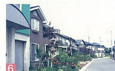
6 美咲町住宅団地 美咲町 地区計画による街づくりで、街全体が緑で覆われ、特にサザンカの生け垣が美しい街です。