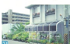
21 家の周りが花で囲まれており、所狭しと並べられたプランターは圧巻です。