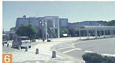
6 マリンピア日本海 西舟見町 松林の中にある建物で、形や色彩が周囲の緑や日本海にも調和しています。