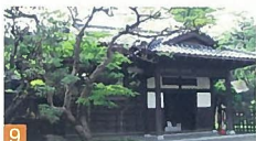
9 旧日本銀行新潟支店長宅 西大畑町 古いたたずまいの家で、中には部屋が多くありますが、癒下したいにどの部屋にも行けます。