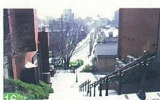
16 どっぺり坂からの眺望 西大畑町 高台から新潟市内を一望できる風景が、とても素敵です。