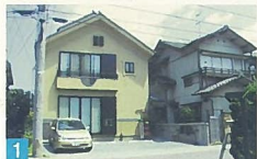
1 入口脇の扉に、良寛の詩碑と良寛碑がめ込まれており、独特の景観を表現しています。