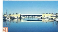
31 鳥屋野潟公園カナル橋 清五郎 カナルに架かる橋で、昼間の表情と夜間の表情が違うという二面性を持った美しい橋です。