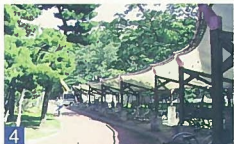
4 新潟青陵女子短期大学 水道町1 松林の中という立地を生かすとともに、自転車道場や滝下などのデザインが優れています。