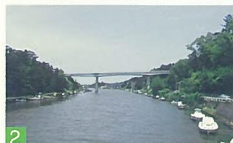
2 新川治い 新川 川に係留している舟、空には大きな雲、川沿いを歩くように並び家々の光景にため息がでます。