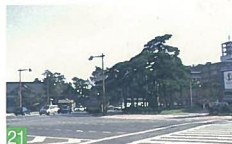
21 白山神社前の風景 一番堀通町 白山神社の松を背景に、噴水公園と舟倉の緑が相まって豊かな緑地として目に映えます。