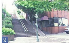
9 異人池ハウス 西大畑 新潟とは思えないエキゾチックな雰囲気、たまらなく素敵です。