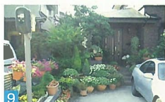
9 庭の樹木が良く手入れされ、飾られたお花もきれいで、道に潤いを感じさせています。