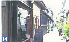
14 FULL MOON 東堀通4 古い民家を改装したお店で、建物の古さを生かし、独特な雰囲気をもっと出しています。