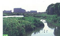
47 清五郎湯 清五郎 水辺に影を写す大きな柳、柳の枝間に見える土蔵造りの建物、紅い欄干の橋に立てば心癒されます。