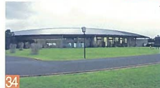
34 ラ・ピアンタ 清五郎 野鳥をイメージした建物で、曲線を使った横に長く低い建物は、公園の起伏に良くマッチしています。