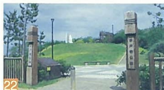
22 水戸教公園 雲雀町 みなと新潟の象徴です。