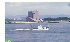
40 海の玄関新潟港 信濃川河口 信濃川の船上から河口を望む光景は、五港の一つの新潟の顔です。