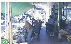
32 本町市場 本町14 活気のある声が飛び交う本町市場は、新潟のものです。