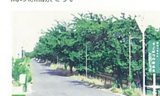
60 新潟バイパスからの眺め 新潟バイパス 橋上から望む河口は、色々な景色が見られ素晴らしいです。