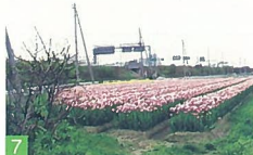
7 立仏周辺のチューリップ 立仏 チューリップのいるどりがきれいです。