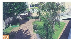
12 白山歩道橋周辺の緑化 白山浦2 乗降客の多い駅近くにある公園で、通行時に涼いを感じてもらえるよう配慮されています。