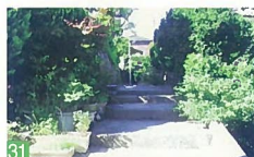
31 下町の路地裏 下町一帯 下町の路地裏には、子供達の登下校時のにぎわいがあります。