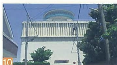
10 日本海タワー 旭町通 海岸の高台から、松林越しに夕日がタワーを紅く染めた風景が暖かく、何ともいえません。