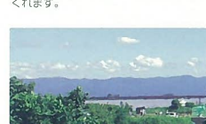
59 阿賀野川からの山並み眺望 阿賀野川河口左岸 晴れてくっきり見える山並みの眺望は、とにかく美しいです。