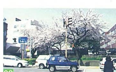
20 大学病院下の桜 学校町通 市内で一番早く咲くこの桜を見て、新潟の春を実感します。