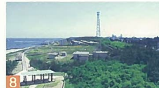
8 西海岸公園防風防砂林 西海岸公園 飛砂を守るために植えた松林が大きく成長し、市内には数少ない大きな緑地空間を提供しています。