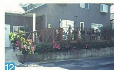
12 ウッドデッキが道路側に設けられ、そこに多くの花が飾られて、道行く人を楽しませてくれます。