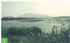
1 佐潟 赤塚 渾身のもつ豊かな自然美と海を取り巻く人との共生が図られていることは新潟の誇りです。