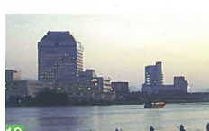
19 県庁と千歳大橋の夕夜景 やすらぎ堤左岸 雄大な信濃川の流れに映える県庁舎や千歳大橋の灯が、新潟らしい景観となっています。