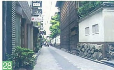
28 鍋茶屋通り 東堀通8 古風な建物と白壁の塙が調和して、落ち着いた街並みを見せています。 都市景観賞部門賞