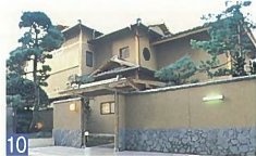
10 イタリア軒「割烹 蛸」 西堀通8 蛸谷虹児の花嫁人形の歌謡を前庭に取り込み、新潟らしい風情ある外観がとても美しい建物です。都市景観賞 部門賞