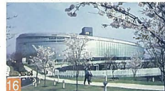
16 新潟市民芸術文化会館 一番畑通町 建物のデザインや色彩が洗練されているとともに、周囲の自然がこれと融合し素晴らしい雰囲気です。都市景観大賞