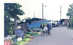
12 ニ・七の市 酒屋 2と7のつく日に開かれる市で、元気なおばさんが新鮮な野菜や魚等を売っていて、活気があります。