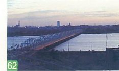
62 落日の松浜橋 松浜 春と秋に見られる松浜橋の真上に落ちる大きな太陽は、素晴らしいです。