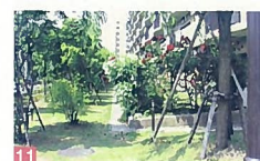
11 グリーンタウン東新潟自治会 中島1 自治会が取り組む緑化活動で、庭の花が春から秋にかけて素晴らしい咲きます。