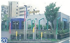
20 新潟シーエムサービス 新和 シンプルな建物に、ポップな色づかいでアクセントを加え、気持ちを明るくしてくれます。