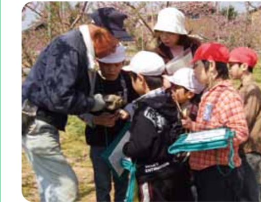
小学3年・総合的な学習の時間「桃、梨、ぶどうについて調べよう」