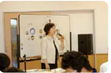
食育指導者の学校派遣