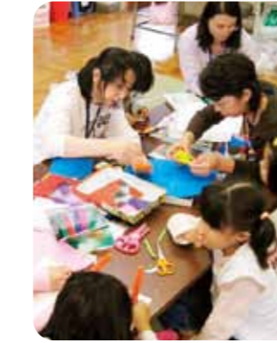
ふれあいスクールでの交流活動