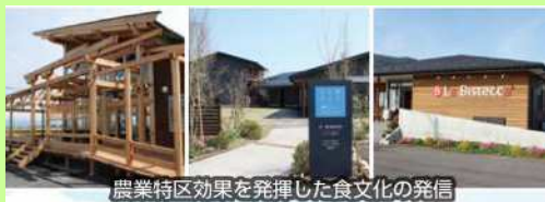
農業特区効果を発揮した食文化の発信