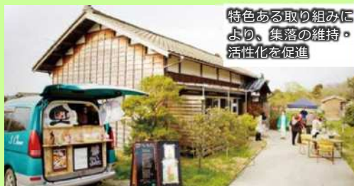
特色ある取り組みにより、集落の維持・活性化を促進