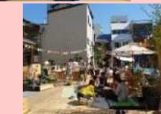
低未利用地を集約し、子育て 施設や交流広場として活用 ※イメージ