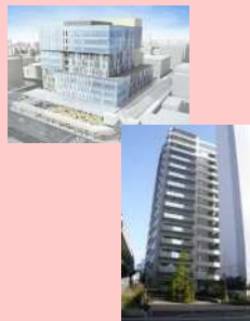
都心における開発 (イメージ)