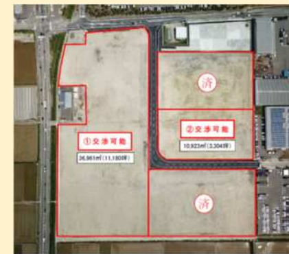
(新潟市新たな工業用地リーフレットより)