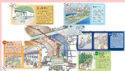
新潟都心の都市デザイン