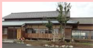
地域の茶の間として活用