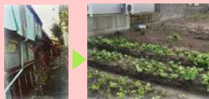
空き家跡地を コミュニティ農園として活用