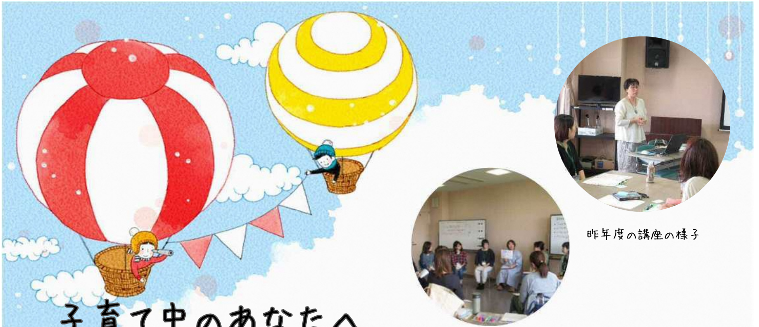
昨年度の講座の様子