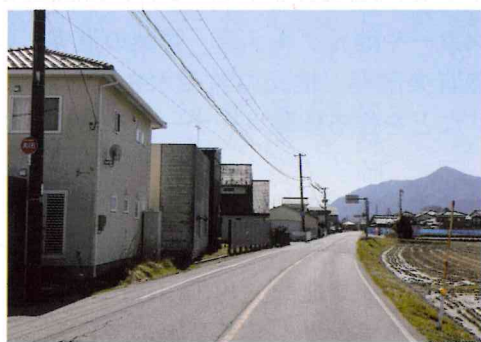
旧峰岡中学校の跡地は現在、住宅団地に

り、高齢者だけの世帯も増えています、昔から続いている向こう三軒両隣のご近所付き合いも希薄になったと感じられます。