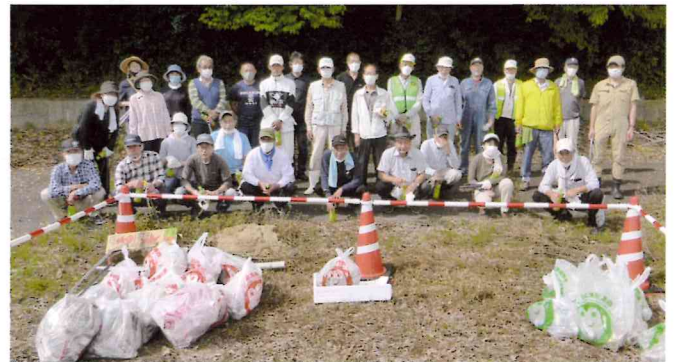
ごみの回収量は燃やすごみが33kg 燃やさないごみが10kgでした。

北国街道クリーン作戦は当コミ協が毎年続けている環境対策活動です。令和4年度は9月25日(日)に、各自治会から2名以上の参加をお願いして行い、一昨年から実施している稲島から角田碎石へ続く角田山麓公園線のゴミを拾いました。角田方面から稲島へ向かって