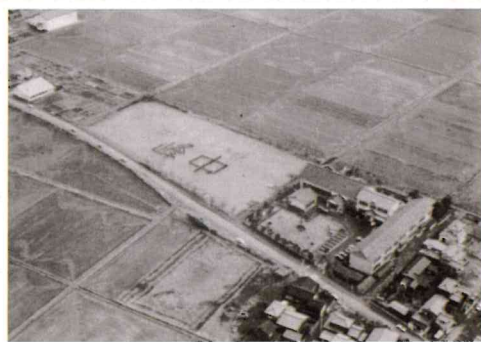
旧峰岡中学校 昭和55年(1980年)当時