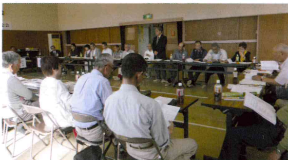
コロナ感染流行前のコミ協総会

これからも安心安全に暮らし続けられるまちづくりを引き続き進めていくため、皆様方のご支援とご協力をお願いします。