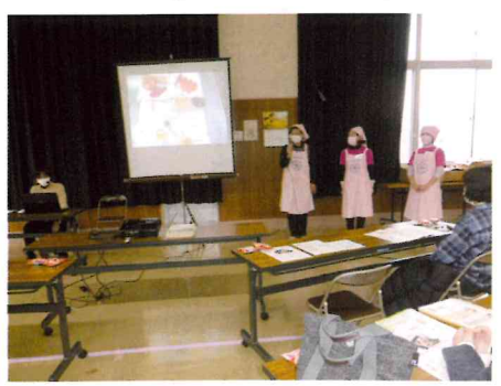
健康づくり教室 (栄養学習)