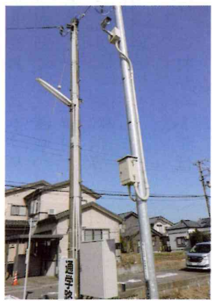
新設した防犯カメラ(右柱)

おとし、コミ協と協力して新潟市の補助を受け、南小学校への通学路に防犯カメラを設置しました。