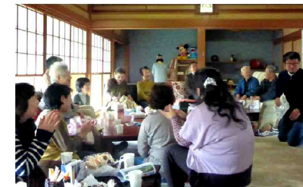
参加者は日平均20～40人。午前10時から午後4時まで出入り自由。

茶碗やマグカップではなく紙コップを使うのは、衛生管理につながるほか、自分の名前をマジックで書くことで、名刺の代わりに、相手の名前がすぐ分かり、会話ははずむ。寄付品による即売バザーも行い、運営費に充てている。また、エアコンやストーブ、冷蔵庫などは地元企業からの寄付。