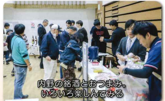
内野の銘酒とおつまみ。いろいろ楽しんでいる