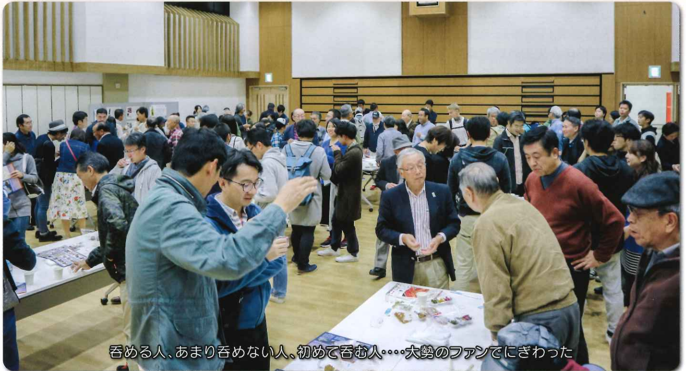
呑める人、あまり呑めない人、初めて呑む人・・・大勢のファンでにぎわった