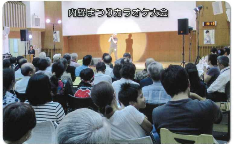
内野まつりカラオケ大会