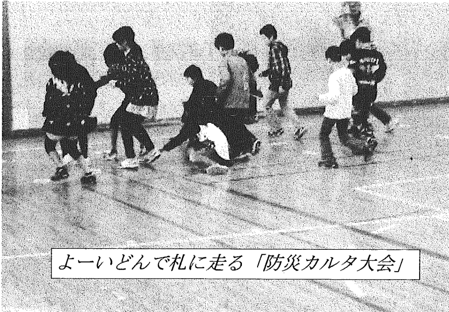
よーいどんで札に走る「防災カルタ大会」

今年も、新潟西警察署小新交番の協力で、子ども用の警察官の制服・制帽をお借りし、ちびっこ警察官誕生コーナーやパトカー試乗体験など初の試みに子どもたちは興味津々でした。