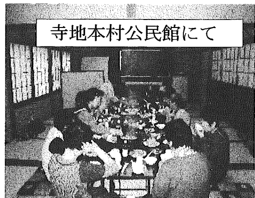
寺地本村公民館にて

11月は、寺地中公園で育てた食用菊の「酢の物」をつくり、用意した鍋料理を囲んで笑顔の食事会でした。