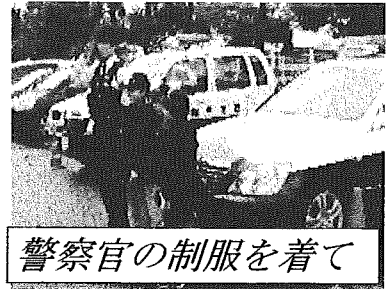
警察官の制服を着て