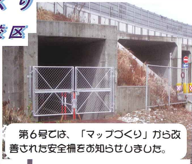
第6号では、「マップづくり」から改善された安全柵をお知らせしました。

また、第8号で新潟青陵高等学校野球部の清掃活動を取材したときには元気な高校生に取り囲まれてのインタビューでした。