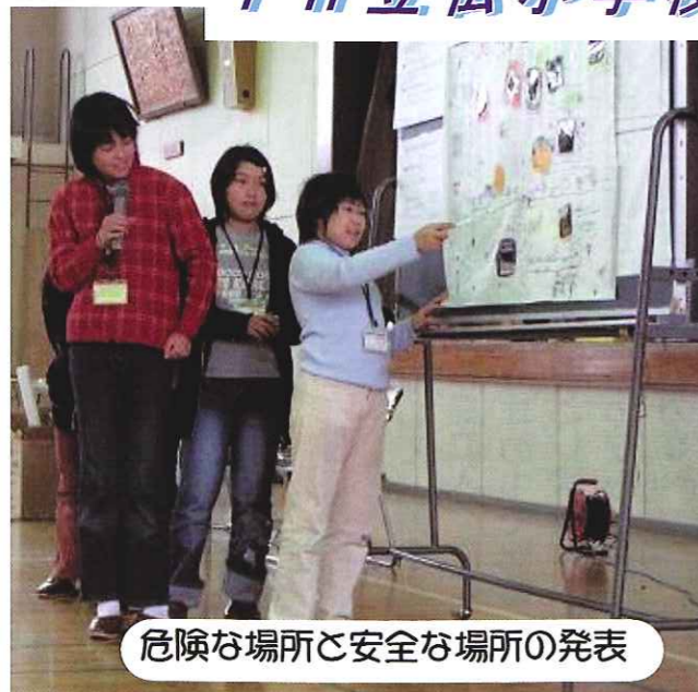
危険な場所と安全な場所の発表