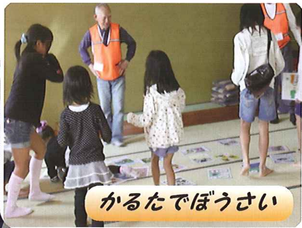
かるたでぼうさい