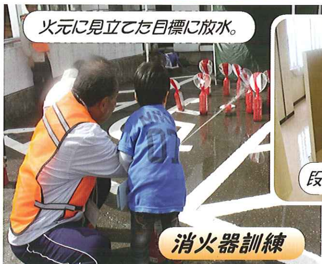
火元に見立てた目標に放水。