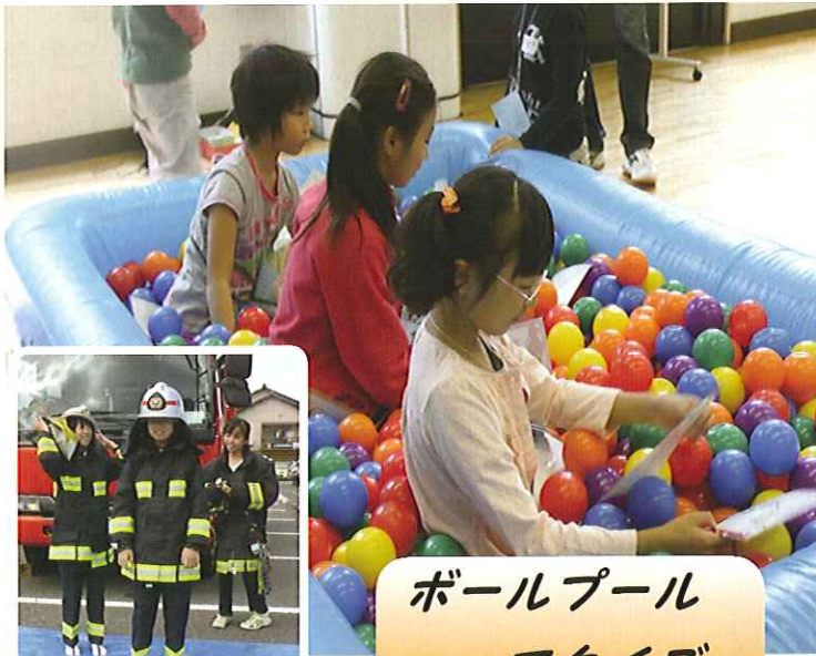
ボールプール でクイズ