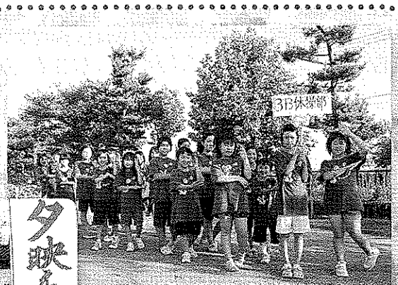
西内野小 3B 体操部