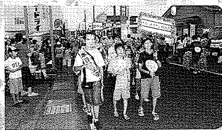
パレットタウン西新潟自治会