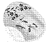
(当日お配りした コミ協オリジナルうちわです)