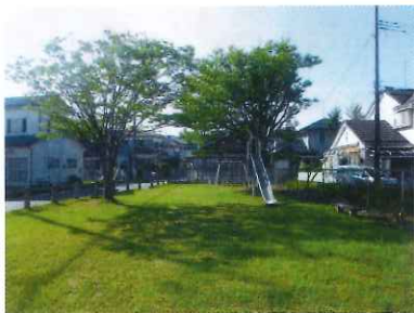
中島なかよし公園

去る8月25日、新潟市黒崎市民会館大ホールにて、西区公園愛護連絡協議会より、当自治会「中島なかよし公園」に対し地域における公園緑地の健全な発展と、その愛護のため永年にわたり公園愛護活動に精励したとの事で、会長賞を受賞しました。大変名誉なことと心から喜んでおります。これを機にますます管理・維持に十分留意し、地域の方々から愛され、子どもたちの歓声と笑顔の絶えない公園造りに、協議会様のご指導を頂きながら邁進したいと考えております。有り難うございました。「中島なかよし公園」が永遠に緑あふれるオアシスでありますように願います。