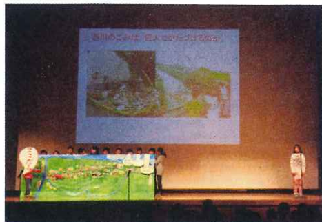
小瀬小の児童によるステージ発表

参加児童による意見交換では、「みんなでごみを拾う」「ポイ捨てをしないよう地域の人に呼びかける」など西川をきれいにするための意見が出されました。