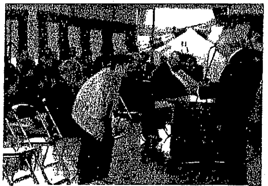
米寿の表彰をうけるおばあちゃん

米寿の表彰が、親子三代ふれあい会の式典で行われた。今年度は大正八年四月から大正九年三月までに生まれた二三名の方々が表彰を受けた。受けられた方々は次のとおり。