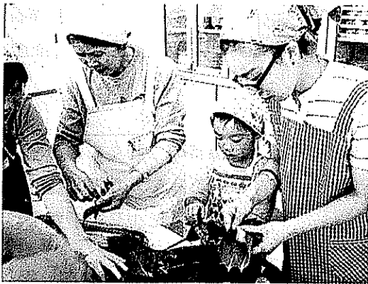
笹団子作っておいしくたべちゃお(教育文化部会)H20.10.19 黒埼南小