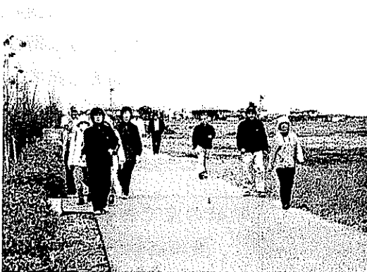
水辺公園ウォーキング(健康福祉部会)H20.10.26 黒鳥水辺公園