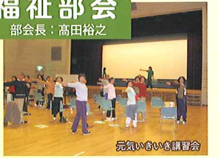
元気いきいき講習会

○十一月四日、西新湊市民会館音楽室に於いて、西区福祉課健康係、地域包括支援センター、青山公民館の協力で、歯科衛生士二名を講師に迎え、歯の健康講習会「子どもも大人もcome 噛む健康」を実施しました。参加者は二十名ほどでしたが、口腔衛生の大切さと食欲の楽しさ・喜びを実感しました。講習会はもちろんのこと、コミユニケーションの場としての意義もはかれ、たいへん有意義な時間でした。