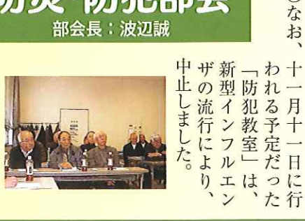
新型インフルエンザの流行により、中止しました。

○「防災・防犯部会」会議 八月二日／西新湊市民会館3F講座室 ・今年度の事業計画について ○「自主防災に関する勉強会」第一回勉強会 九月六日／西新湊市民会館3F講座室 ○「自主防災に関する勉強会」第二回勉強会 十月二十五日 ・東区西物見山防災会、恒例の防災訓練にオーブン参加 ○自主防災組織に関する合同会議 十二月五日／西新湊市民会館3F研修室 ・自主簿防災組織づくりの現状と課題について ・合同防災訓練の実施について ○なお、十一月十一日に行われる予定だった「防犯教室」は、「防犯教室」は、新型インフルエンザの流行により、中止しました。 ※今年度は学習を中心に活動しましたが、来年度は合同訓練を実施する予定です。