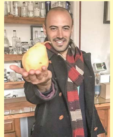
ジン製造会社「オーデマス社」にル レクチエ到着

その際にはル レクチエへの農家さんたちの想いも伝え、また南区の観光PRにも努めたいと思います。東京オリンピック・パラリンピック開催に向けて、ル レクチエ・白根大風合戦・角兵衛獅子・大名行列など、世界に誇れる素材をたくさん持つ南区を世界に発信します。