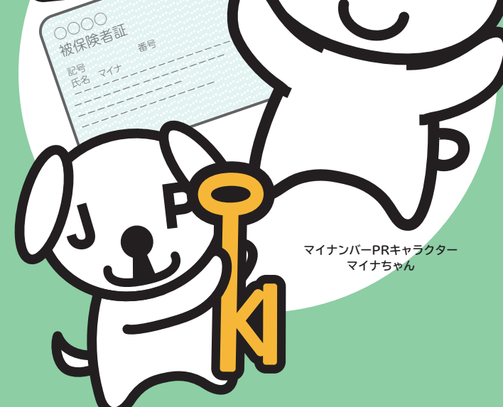
マイナンバーPRキャラクター マイナちゃん