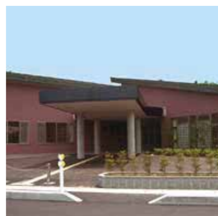
金津地区コミュニティセンター