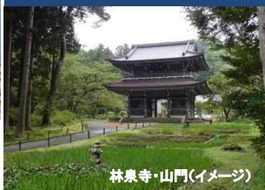
林泉寺・山門(イメージ)