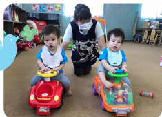
ボランティア活動時の様子

かわいいふたごちゃん、みつごちゃんのお世話をすることで ママさんパパさんを応援しませんか？