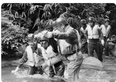
沢のぼりではボランティアさんが危なくないようにサポートしてくれました