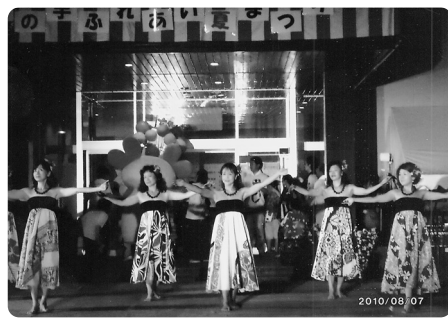
華やかで素晴らしいフラダンスチームが初参加