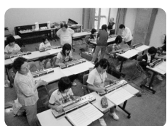
のみこみが早い子供たち

大正琴は老人の楽器と覚えておられませんか？ 老若男女！！大人も子ども誰でも弾けますよ。 数字の楽譜ですから、すぐにできますよ。 おとっちゃんも、おかあちゃんも大正琴をならって、 奏でる喜びを味わいませんか。