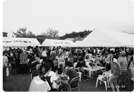
1,650名以上の入場者でにぎわった飲食ブース

冒頭に旧小須戸町の火災により、大勢の方々が被災されました。山の手コミュニティ協議会より心からお見舞い申し上げます。今年は、雨の心配もなく昨年をしのぐ来場者がありました。まずは事故なく、無事に終了する事が出来た事は、ふれあい事業部、各団体、地域の皆様のご協力のおかげと感謝申し上げます。