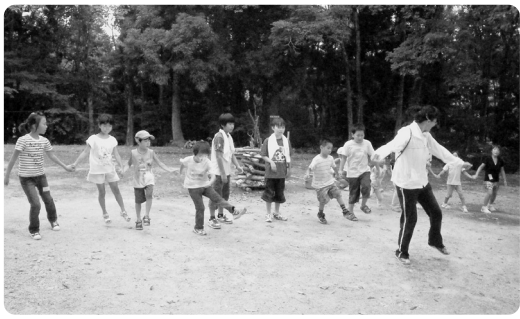
夜を待って「マイムマイム」の予行練習

今年度より参加している親子キャンプ教室では、普段出来ないような体験をさせていただけるのですが、中でもキャンプは私も子どもも人生