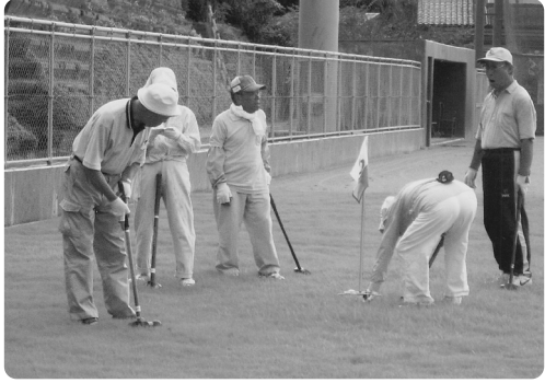
上「スポレック」、下「グランドゴルフ」

今月の公民館報では地元で実際に活動しているニュースポーツ(いつでも、どこでも誰でもを合言葉に生まれた健康づくりを目的としたさまざまなスポーツ)を今後シリーズで紹介していきます。 誰もが気軽に始められ、体力維持やフレッシュにも効果的。仲間づくりもできます。あなたの時間をさらに豊かにするために、これから軽スポーツを始めませんか。 〔現在、小須戸地区で活動しているニュースポーツ〕 ・ スポレック ・ グランドゴルフ ・ ソフトバレーボール ・ 3B体操 ・ スポーツチャンバラ ・ スリッパ卓球 ・ ゲートボール 〔公民館で用具の貸出しや指導が可能なニュースポーツ等〕 ・ 缶蹴りスポーツ(新潟発祥) ・ ターゲット・バードゴルフ ・ フライング・ディスク ・ ユニホッケー ・ トリットボール