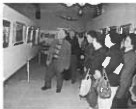
昨年の解説会の様子