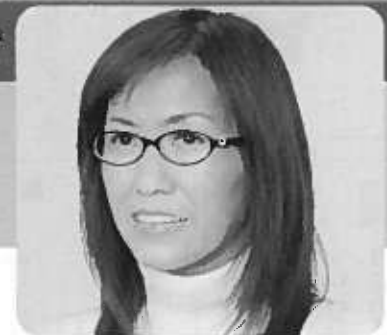
講師の近況 「老後がこわい」を出版し、著者インタビューに追われております。

【応募方法】 往復はがきでご応募ください。11月20日(土)必着。《先着300名》