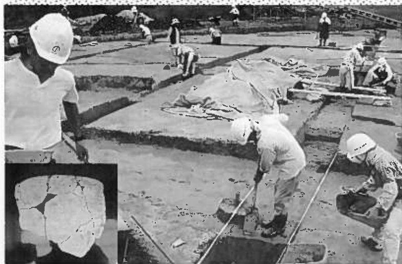
縄文土器 大沢谷内遺跡の発掘

天ヶ沢新田にある縄文・室町時代の複合遺跡「大沢谷内遺跡」が、県内でも今後注目される発見といわれています。この遺跡は、小須戸地区の天ヶ沢沖で、その範囲は○・五平方キロ以上と推定。上層からは平安・室町時代の集落跡、下層からは縄文時代の集落跡が確認された。新潟市埋蔵文化センターの職員は「縄文時代の遺跡が平野から発見されるのは非常に