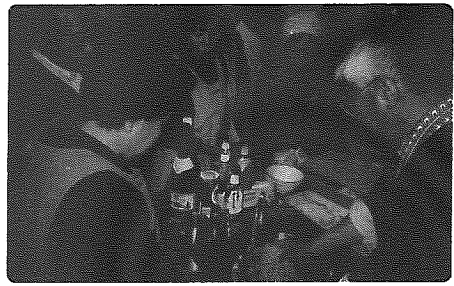
自分でつくったそば、どんな味…?

活動終了後、苦心して作ったそばを、大事そうに持って帰って行く参加者の姿が印象的でした。