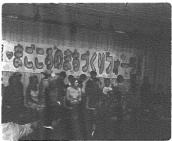
おばあちゃんと孫が一緒になって

平成十二年の町制施行百周年を機に、まごころの町宣言が提唱されたことを受け、去る十一月二十九日(土)に第三回「まごころのまちづくりフォーラム」が開催されました。このフォーラムは、心豊か