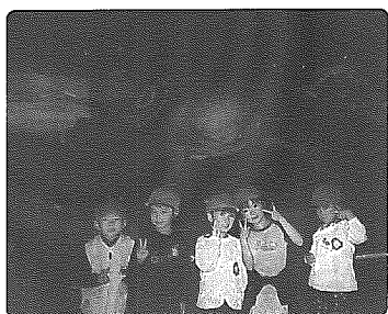
県立自然科学館でいろいろ学びました

小須戸町の町民憲章には、「豊かな人間性の確立と住みよい町づくりを目指す」と謳われております。二十一世紀を迎え、急速に進展するいろいろな大きな変革の中で、新しい時代を心豊かに生きていくために必要とされる資質や能力が求められています。こうした時代だからこそ生涯を通じて学び続けることが必要となり、学校教育と共に社会教育の重要性が強調されており、人生八十年時代といわれる現代では、物質的な豊かさから心の豊かさへと目が向けられています。町の中央公民館では、施設の整備と共に数多くの教室や講座を設けて生涯学習を推進し、町民だれもが気軽に芸術や文化に親しめ、レクリエーションなどに参加できるよう環境づくりに配慮して事業に取り組んでいます。子どもからお年寄りま