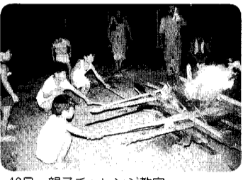
10日 親子チャレンジ教室 花とみどり園にてキャンプ活動。火の神の号令により火の子達からまきまきに点火される場所です。