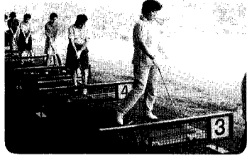
ボールをよく見て打ちましょう～

「子育てに追われていて今まで忙しかったが、この教室に入ってゴルフを基本からやりたい」「主人ばかり楽しんでいたので私も覚えて、主人と一緒に楽しみたい」等が、レディースゴルフ教室へ入った人の動機の声である。 今年度から新しくレディースゴルフ教室を公民館で開催したところ、意欲的でビビ子とした女性二十三名から申し込みがありました。