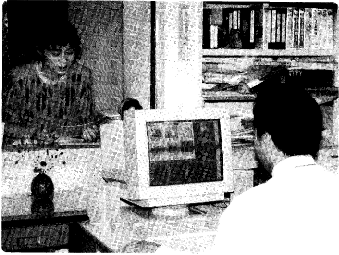
窓口での相談にも即座にお答えします!!