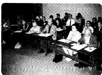
昨年の学校開放講座の様子です

※既にチラシが配布されていますので、申込書を中央公民館か新津南高校へ持参願います。(九月二十五日切ります)