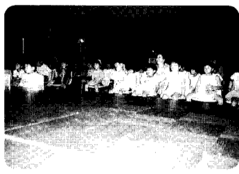
7日 夏休みアニメ映画会 大きな画面に映るアニメを熱心に見ていました。