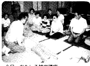
9日 おもしろ雑学講座 消防本部の消防士が、救急法を学びました。