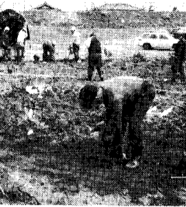
当日は、大変に風の強い日でありましたが、会長及び会員多数の参加を得て、予定通り正午に終了することができました。また、出品者の皆さんから破格の価格で苗木を提供していただき、本

十周年記念事業の目玉ともいえるライオンズ花木園の造園を去る四月九日朝八時より、会員十七名スコップ持参で集合、なれない手つきで施行いたしました。場所は、小須戸町雁巻堤外地で、テニスコートの隣りに直径二十mの円型に十五mの土盛を施し、中心に円型の休息場を造り、南北に幅二mの遊歩道を設けました。この花木園には、サツキ、ボケ、シャクナゲ、牡丹、その他の種類合計二百五十本、苗木はすべて花保証の品物で、シーズンになればサツキ、シャクナゲ、ボケ等々の花の見本園として後々まで小須戸町民の皆さん、また近郊の花の愛好者より愛されることを、心に念じて造園した次第であります。