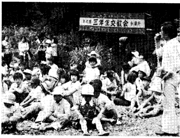
五月三十日、好天に恵まれて、小須戸幼稚園第二回卒園児(現小学三年生)の交歓会が大沢で行われました。田植の終わった最初の日曜日、関係児童の半数以上が参加し、招待した幼稚園の先生、関係父母