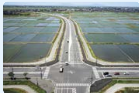
新潟中央環状線(豊栄→横越方面を望む)