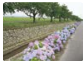
●清五郎排水路のあじさい