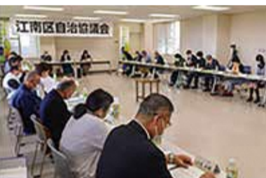
今年度の第1回自治協議会の様子

自治協議会には、 ①区民の声を反映させる ②委員自ら地域課題解決 という大きな2つの役割があるぞい。詳しくは、右の二次元コードを見るのじゃ。