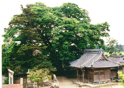
大久保の大ケヤキと神明社