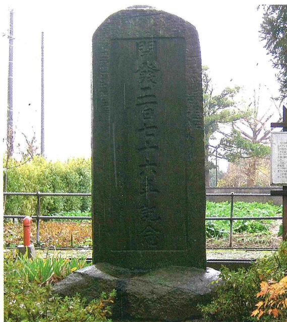
「開発二百七十六年記念」の石碑

石碑の脇には、樹勢盛んな「大久保の大ケヤキ」が立っています。市指定の天然記念物で、北区では「高森の大ケヤキ」に次ぐ大きさで、推定樹齢300年、目通り5.9m、高さは約25mです。石碑とともに、大久保の歴史を物語る大樹です。