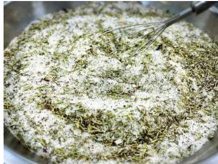
※ハーブ、スパイスはお好みで調整可能