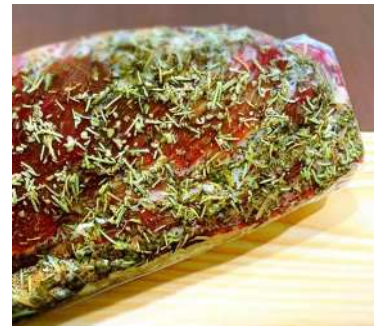
※完成品の可食部は500g程度 真空パックにして郵送します