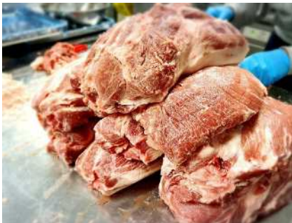
※1人1kgの肩ロースを使用