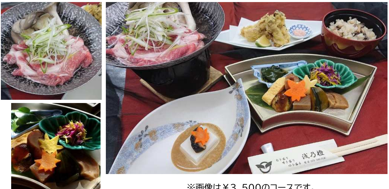
※画像は¥3,500のコースです。