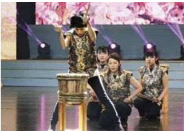
永島流新潟樽砵伝承会