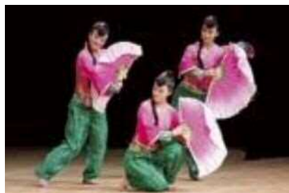
青島市歌舞劇院有限公司