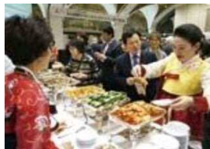
韓国料理担当は新潟の人気韓国料理店