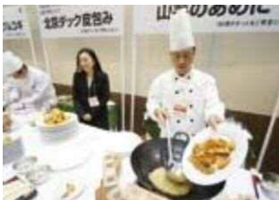
青島市一流ホテルのシェフが「山芋のあめに」を披露