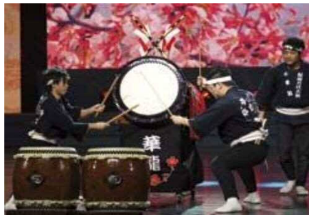
新潟万代太鼓 華龍