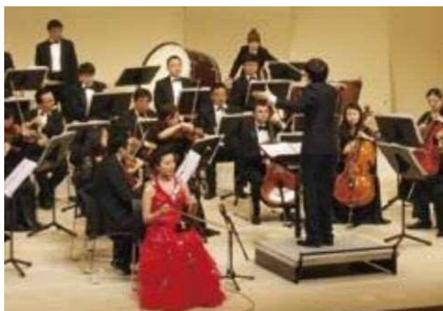
広大な大草原を馬で競う情景を二胡で表現