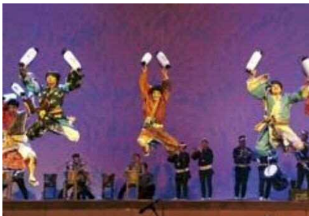
にいがた総おどり、永島流新潟樽砧伝承会