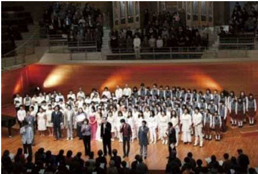
会場全体が一体となり、感動に包まれた全員合唱

「東アジア文化都市 2015 新潟市」オープニングイベントのひとつとして開催された、第7回「千の風音楽祭」。新潟市は、名曲「千の風になって」を訳詞・作曲した新井満さんの出身地であり、「千の風のふるさと」です。