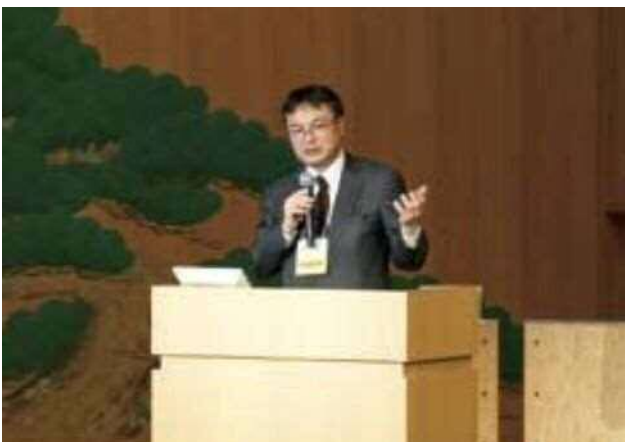
太下氏の基調講演