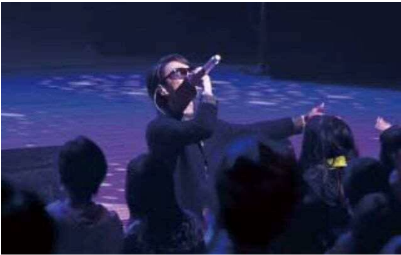
会場の熱気が最高潮となった Hilcrhyme の公演