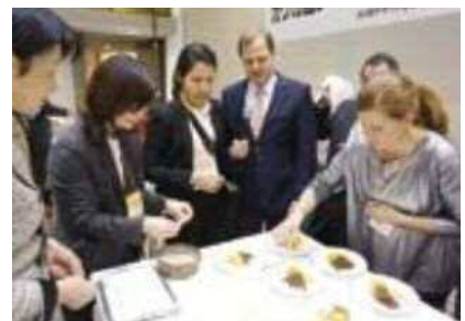
コロンビア料理もブースに並ぶ国際色豊かなディナーパーティー