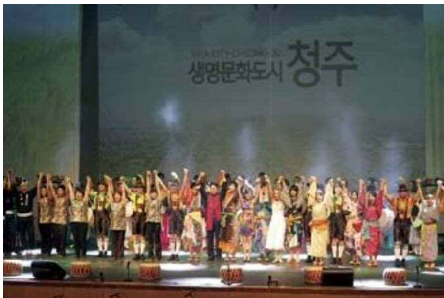
フィナーレではアリランを参加者全員で合唱

清州市のオープニングイベントは、「清 (CHEONG)」のスペルの頭文字から「Clean (清)」「Happy (幸)」「Edutainment (学)」「Origin (本)」「Networking (結)」「Glocal (和)」をテーマに、3都市の芸能団による公演などが行われました。本市からは新潟万代太鼓 華龍、永島流新潟樽砧伝承会、にいがた総おどりが1,900人の清州市民の前で公演を行い、新潟の伝統芸能や踊りの文化を発信しました。フィナーレでは参加者全員でアリランを合唱し会場が一体となり盛り上がりました。