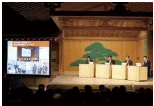
3都市代表者によるパネルディスカッション