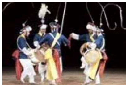
清州市・ノリマダン ウルリム