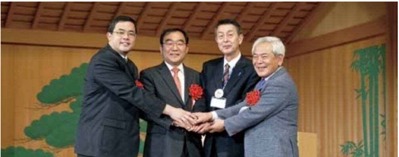
今後の友好交流を約束

外交とはまた違う世界なんだろうけど、俺たち民間だけでも手を取り合っていきたいと思っています。