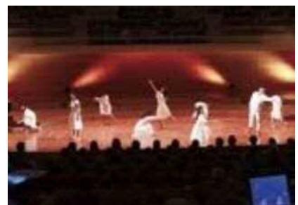
創作ダンスで「千の風になって」を表現