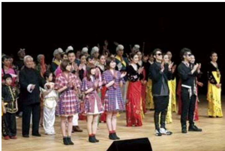
全出演者が勢揃いしたフィナーレ

2015年の東アジア文化都市である新潟市、青島市、清州市の芸能団が一堂に会して共演する特別なステージ。磨き上げられた珠玉の技と音色で東アジア文化都市 2015 新潟市の幕開けを盛大に飾りました。新潟市からは、和楽器ユニット「音魂」といいた総おどり、永島流新潟樽砵伝承会が出演。青島市、清州市を代表する芸能とともに迫力ある演奏と演舞で観客を魅了しました。