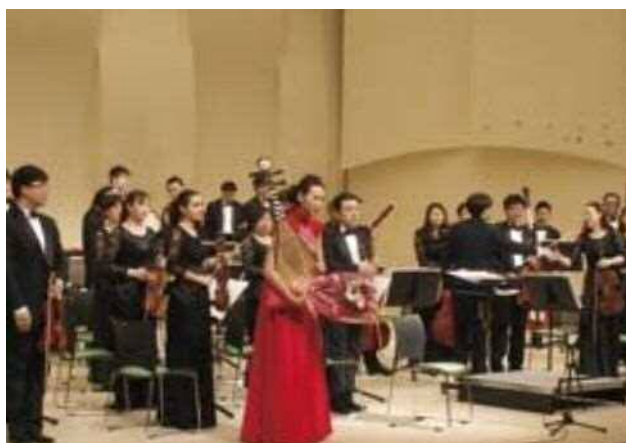
力強い琵琶の演奏を終えて