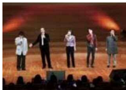
日中韓のゲストによる「千の風になって」