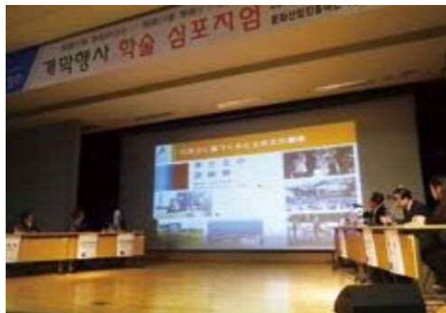
シンポジウムでは各都市の取り組みを発表