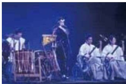
和楽器ユニット「音魂」

また、3都市の芸能披露では、新潟市から市内の住職で構成される雅楽の団体「新潟楽所」が厳かな演奏を披露しました。