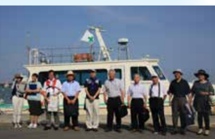
港湾業務艇「あさひ」での西港周辺視察