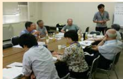
具体的な取り組みを検討中