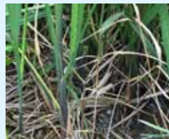
佐潟の水辺に自生する真菰(マコモ)

昔、新潟漆器の職人たちは、鳥屋野潟や福島潟などの「潟」に群生する「真菰(マコモ)」を買いに行きました。現在も真菰(マコモ)の乾燥粉末は、竹塗の表情付けに欠かせない材料として重宝しています。国の伝統的工芸品指定技法「竹塗」と、伝産法の原材料にも指定される「真菰(マコモ)」の取れる「潟」との関わりをご覧ください。