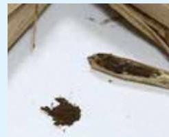
乾燥真菰(マコモ)と茎の中の粉末