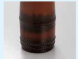
竹塗—— 煤けている箇所にも真菰(マコモ)を使用