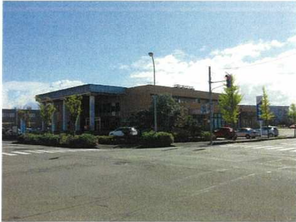
■流通センター会館全景（前面側から）