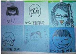
●子供たちの 手書きの 『似顔絵』