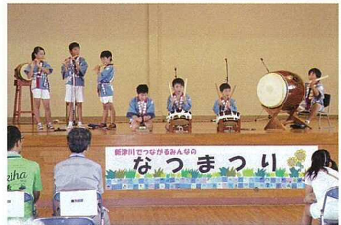
●新町暁進会 子供囃子の「祭り囃子」