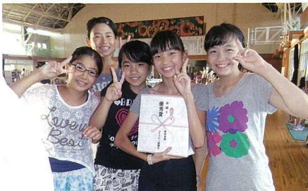
●優秀賞を受賞して「ピース！」