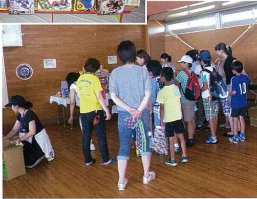
●お祭り広場：射的遊び