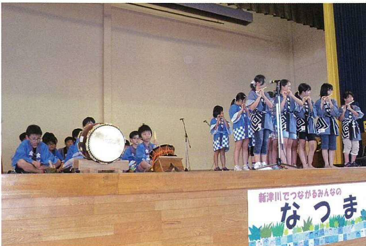
●金沢町屋台囃子の「祭り囃子」