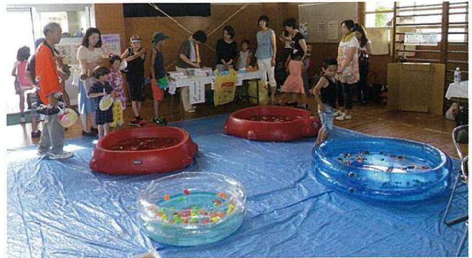
●お祭り広場：スーパーボールすくい