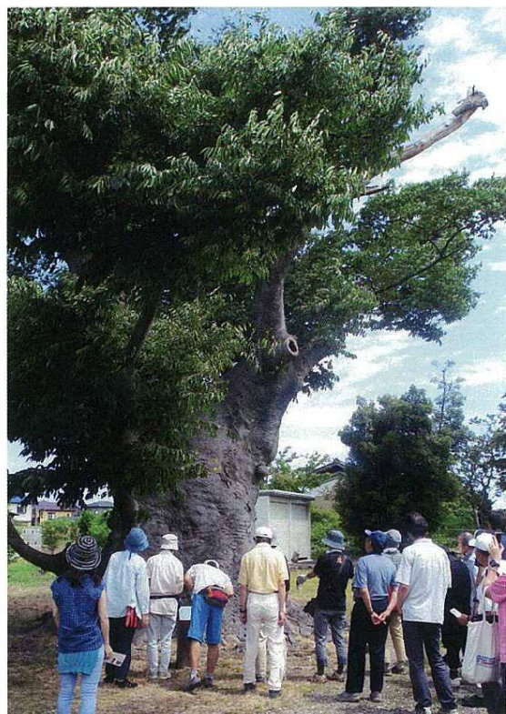
●真柄家の大ケヤキ