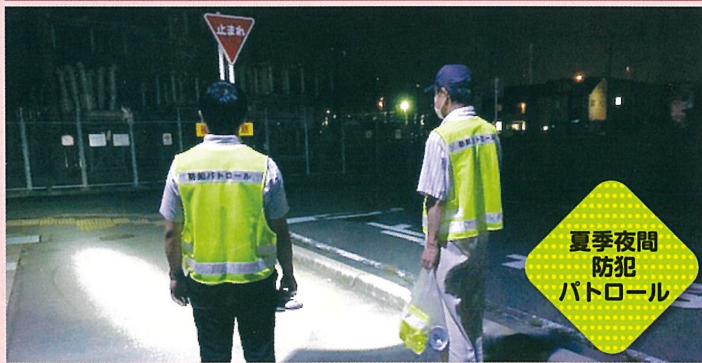
夏季夜間 防犯 パトロール