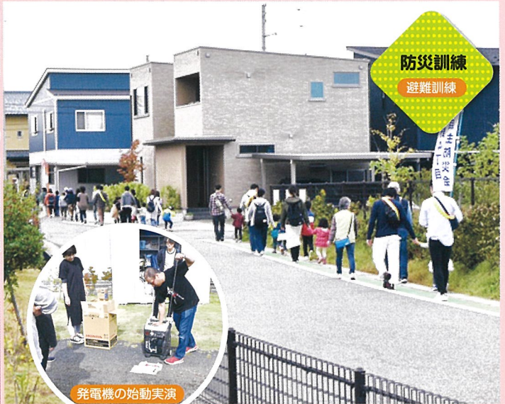
防災訓練 避難訓練