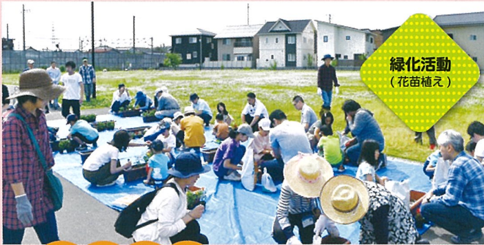
緑化活動 (花苗植え)