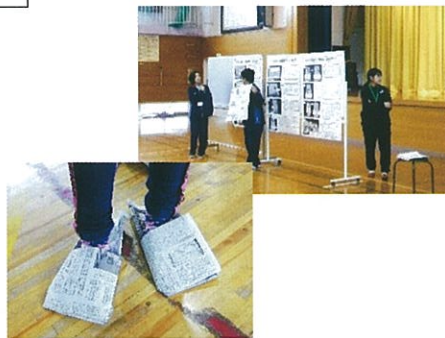
新聞紙スリッパの作り方を中学生が解説してくれました。