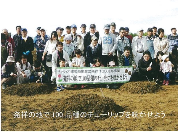
発祥の地で100品種のチューリップを咲かせよう