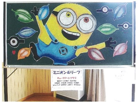
チョークアートクラブ