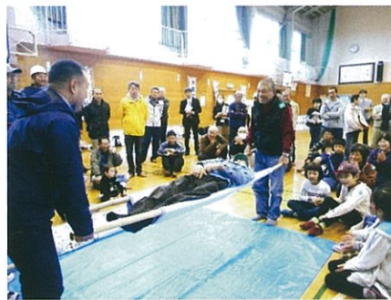
簡易タンカを作り、運んでみます