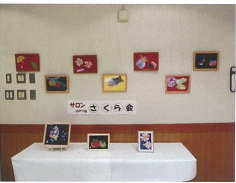
小戸下組 サロンさくら会 作品