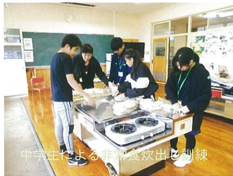
中学生による非常食炊出し訓練