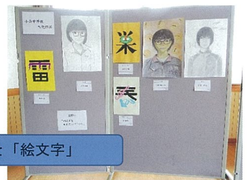
小合中学校の皆さんの「自画像」と「絵文字」