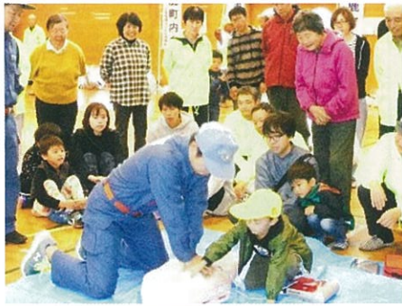
真剣に見守るAED訓練

●来年の春には、臼井橋の(白根に向かって)左側の河川敷に花が咲きます。 主催：チューリップ球根生産100周年事業実行委員会(当コミ協も協力しています)