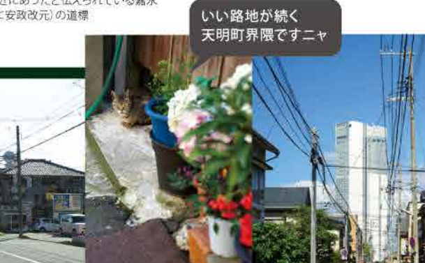
いい路地が続く 天明町界隈ですニャ

「三社神社」は、安倍玄武が流作場の鎮守として延享4年(1747)に創建し、最初は「神明宮」と呼ばれていました。その後、数度の川欠けにより遷座して現在地に落ち着き、明治初期には「三社神社」と改称しました。境内には現新潟駅の近くから移された「石宮神社」や歴史的な碑などがたくさんあります。