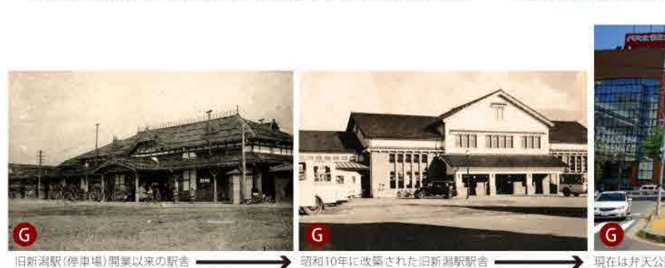
旧新潟駅(停車場)開業以来の駅舎 → 昭和10年に改築された旧新潟駅駅舎 → 現在は弁天公園

明治30年(1897)の沼垂駅開業により周辺にはぎわいが増して、沼垂四つ角周辺は「沼垂銀座」と呼ばれるほどでした。明治37年(1904)に新潟駅が開業すると新潟駅前も新開地となります。大正・昭和期を通じて新潟市の戸数、人口は増大をしていきます。中でも新しい工場ができた沼垂・山の下や流作場は、交通の便が良くなったこともあって、多くの人が移り住み、