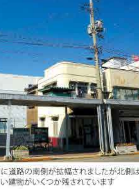
かつてい建物発見! ボクもどこかにいるよ!