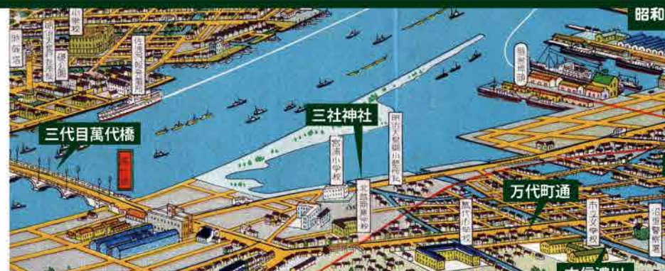
昭和12年(1937)頃に描かれた吉田初三郎の新潟島瞰図