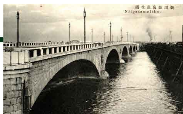
二代目萬代橋の隣に新しく架けられた三代目萬代橋