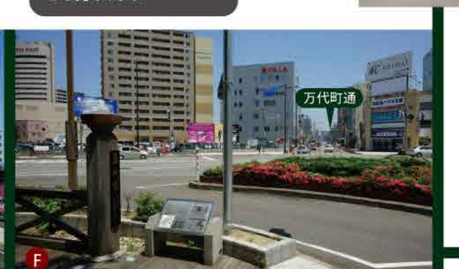
流作場五差路のポケットパーク。萬代橋の名板レプリカと案内板があります。交差点を挟んだ向こうが万代町通

たい焼きの「あま太郎」前から見た万代町通。正面をさす道路が万代町通で、左手が旧沼垂駅と旧新潟駅をつなぐ線路跡の通り