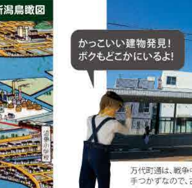
万代町通は、戦争中に道路の南側が拡幅されましたが北側は手つかずなので、古い建物がいくつか残っています