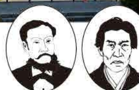
ウシらが架けたんじゃよ～