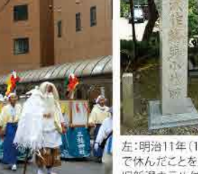
左:明治11年(1878)、明治天皇巡幸の際、安倍家で休んだことを記念した石碑(右:昭和初期まで旧新潟ホテル付近にあったと伝えられている嘉永7年(1854・11月に安政改元)の道標

ツツガ虫除けの神として弁財天を祀った「石宮神社」。当初は今の新潟駅前にもありました。昭和30年に三社神社の境内に移設され、55年に新築竣工し正式に石宮神社となりました